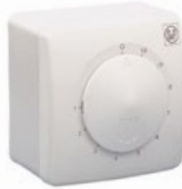
REB 1 N; REB 2,5 N