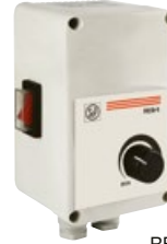
REB 5; REB 10