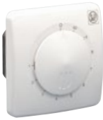
REB 1 NE; REB 2,5 NE

REB 1 N, REB 1 NE, REB 2,5 N, REB 2,5 NE, REB 5, REB 10 – regulátory otáček